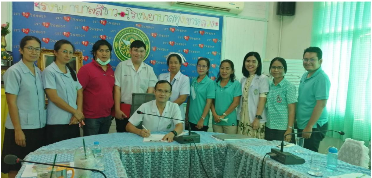
ภาพประกาศ....

- กำมือแนบออกข้างซ้ายตรงหัวใจ แสดงถึงการมี ใจดีรู้ (R:realise) ต่อปัญหาการทุจริต มุ่งมั่นไปสู่อนาคตข้างหน้า (O:onward) ในการแก้ปัญหาเพื่อความเจริญอย่างยั่งยืนของชาติ แสวงหาพัฒนาความรู้ (N:knoledge) ให้เท่าทันต่อสถานการณ์ และมี ความเอื้ออาทร (G:generosity) ต่อกันบนพื้นฐานของจริยธรรมและกฎหมาย สอดคล้องกับโมเดลประเทศไทยสู่ความมั่นคง มั่งคั่ง และยั่งยืน (Thailand ๔.๐)